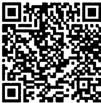
QR code สำหรับลงทะเบียน

สาขาวิชาทารกแรกเกิด ภาควิชากุมารเวชศาสตร์ คณะแพทยศาสตร์ รพ.รามธิบดี มหาวิทยาลัยมหิดล 270 ถนนพระราม 6 เขตราชเทวี กทม.10400