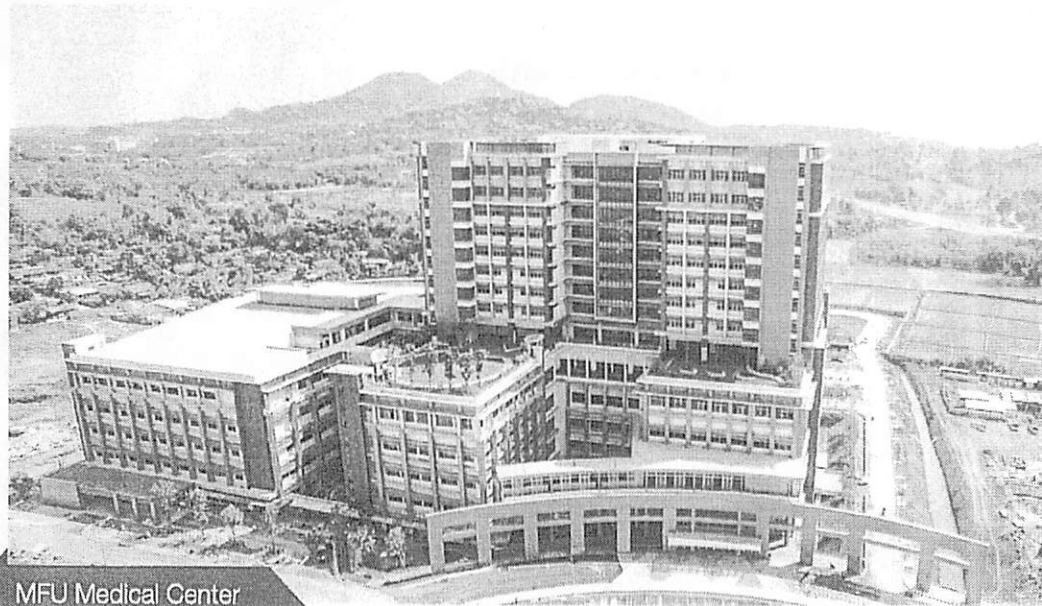
MFU Medical Center